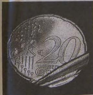
De voor- en achterkant van de mislukte euro.